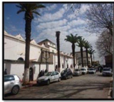
الصورة رقم 04: حركة المرور الدائمة بالحي المركزي