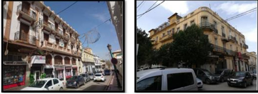
الصورة رقم 02: مباني حديثة داخل النسيج العمراني للمدينة العتيقة

✓ نمط عمراني حديث: بدأت بواده منذ وطأة المستعمر الفرنسي بمدينة تلمسان وهو في استمرار إلى يومنا هذا، حيث أحدث تحولات جذرية في تخطيط المدينة وما نتج عنه من شوارع ودروب واسعة تختلف عن الدروب الضيقة التي تمثل أحد سمات العمارة الإسلامية، إضافة إلى إنشاء المباني العمودية بنمط عمراني غربي وغريب عن نمط المباني التقليدية ذات الطوابق المتعددة.