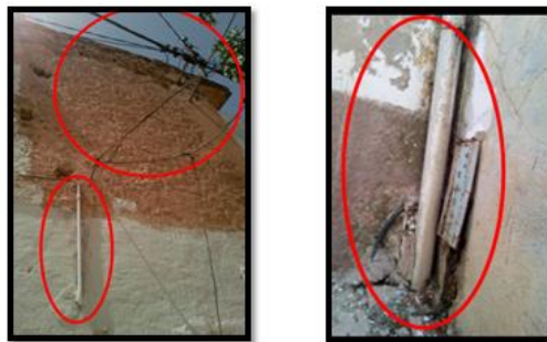
الصورة رقم 03: تأثيرات ناجمة عن أنابيب المياه وأسلاك الكهرباء وما تحدثه من تلوث

✓ استحداث وسائل معيشية حديثة: تتمثل في أنابيب المياه والغاز والصرف الصحي وأسلاك الكهرباء والهوائيات المقعرة... إلخ، وهي وسائل معيشية عصرية دخيلة على النمط المعيشي القديم بالمدينة 1 ، فبالإضافة إلى التشوه البصري الذي ينتج عنها على مستوى مبانيها ودروبها، هناك تأثيرات جانبية كإحداث بعض الشقوق والشروخ نظرا لما تحتاجه عملية التوصيل من إجراءات حفر على مستوى الأرضيات والجدران وكذا وضع العدادات، أو تسرب المياه نتيجة تلف أنابيب توصيل المياه مما يسبب ارتفاع نسبة الرطوبة بجدران المباني.