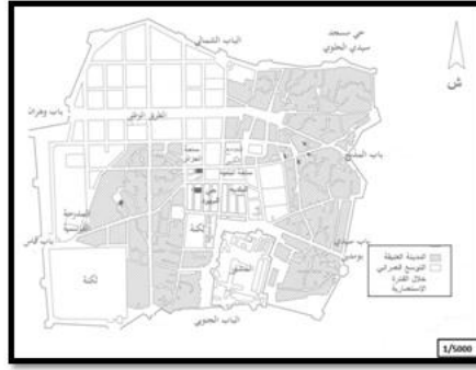
المخطط رقم 02: التوسع العمراني خلال الفترة الاستعمارية