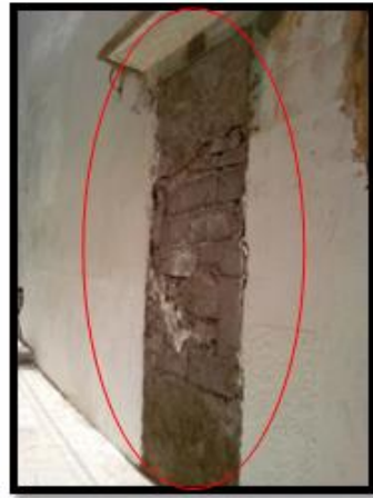
الصورة رقم 01: تدخلات على مستوى المباني بمواد حديثة.