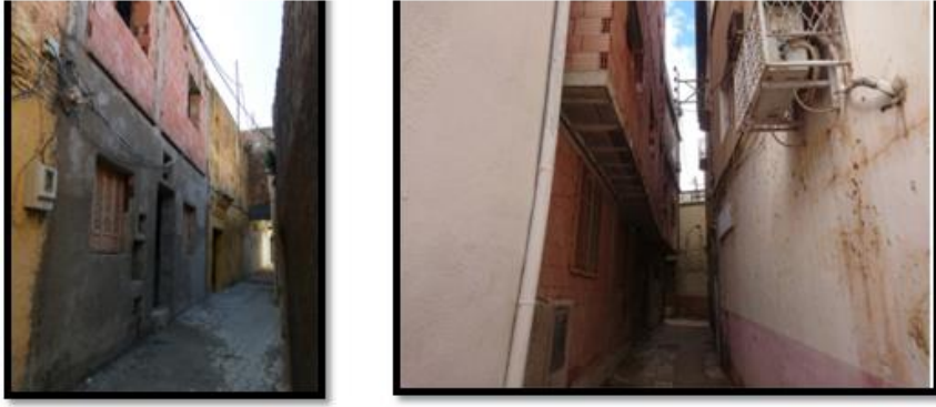
الصورة رقم 05: تجديد المباني السكنية بالأحياء العتيقة

✓ مشاكل الملكية: إن أغلب الملكيات العائلية في المدينة العتيقة تكون ملكيات مشتركة غير مقسمة، ونظرا للخلافات التي تنشأ بين الورثة يمكن أن يؤدي إلى تدهورها طول مدة النزاع، والتي قد تنتهي باللجوء إلى القضاء 1 ، كما تتعرض هذه المنشآت إلى تدخلات عشوائية من قبل أصحابها كما ذكرنا سابقا، ويمكن أن يتم هدمها كلياً وإنشاء مبنى حديث حسب متطلبات الحياة العصرية، فرغم النصوص القانونية التي أبرمت لحل هذه المشكلة إلا أنها لا تزال تلقي التعنت والرفض من قبل أصحاب الملكيات الخاصة بسبب جهلهم بهذا الإرث الحضاري.