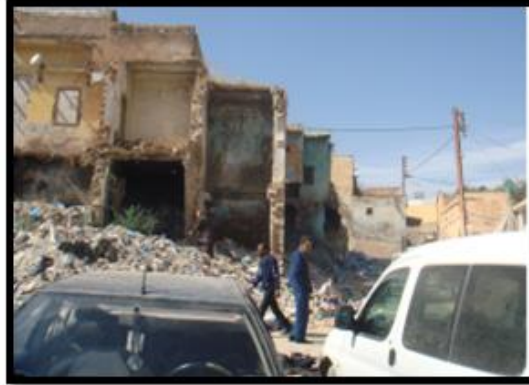
الصورة رقم 06: تخريب وهدم مباني قديمة

▪ الإهمال والجهل: تعتبر هذه النقطة أساس تدهور معالم المدينة العتيقة نظرا لجهل أفرادها بأهمية هذا الإرث الحضاري، مما ينتج عنه في أغلب الأحيان مجموعة من التدخلات العشوائية التي يتم من خلالها طمس معالمها. إضافة إلى التخريب والسرقة الذي تتعرض له بعض المواقع الأثرية والمعالم التاريخية بالمدينة.